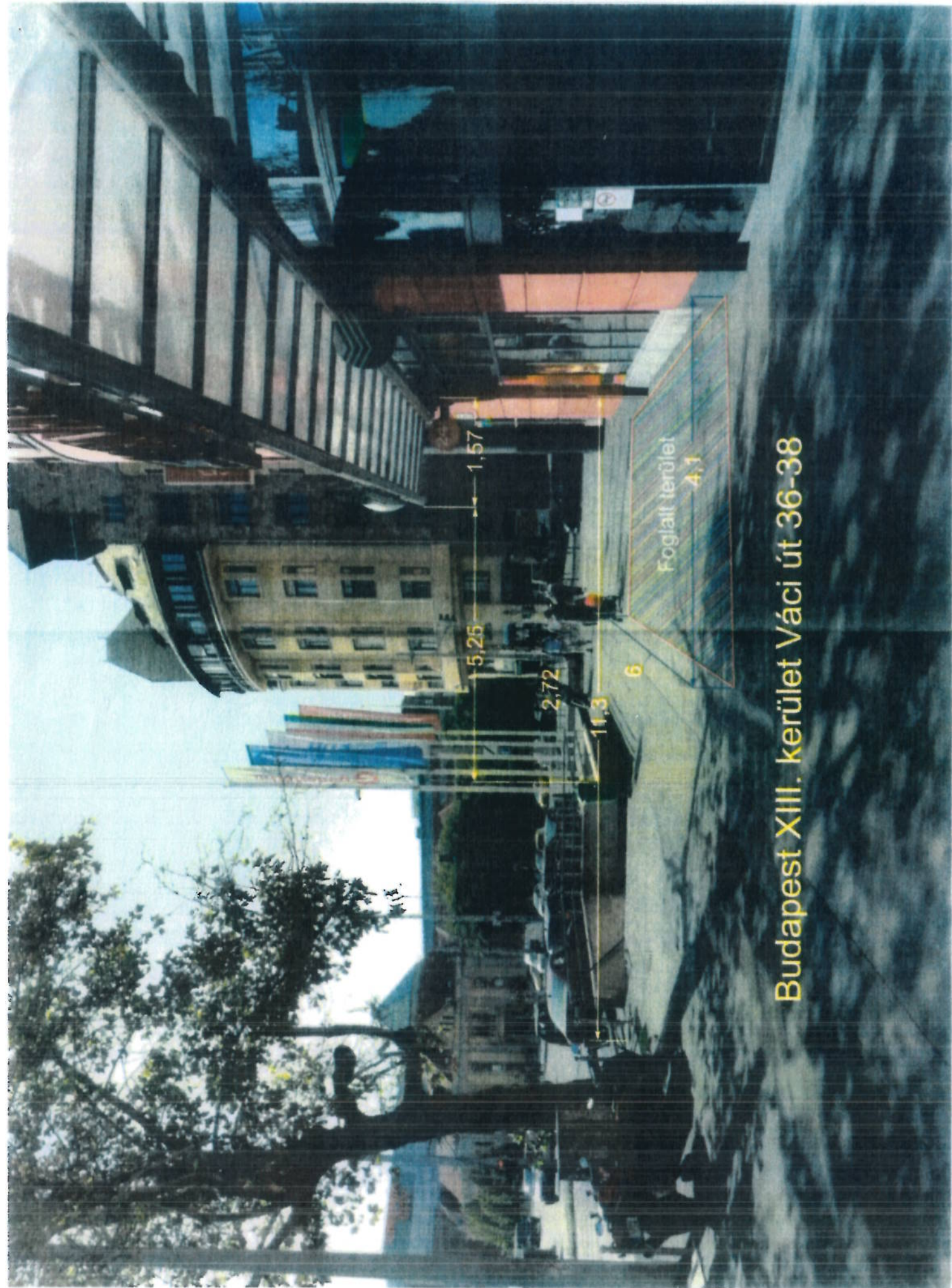
Budapest XIII. kerület Váci út 36-38