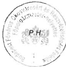
Kerpel-Fronius Gábor főpolgármester-helyettes

A főpolgármester – a katasztrófavédelemről és a hozzá kapcsolódó egyes törvények módosításáról szóló 2011. évi CXXVIII. törvény 46. § (4) bekezdése alapján gyakorolt –hatáskörében eljárva: