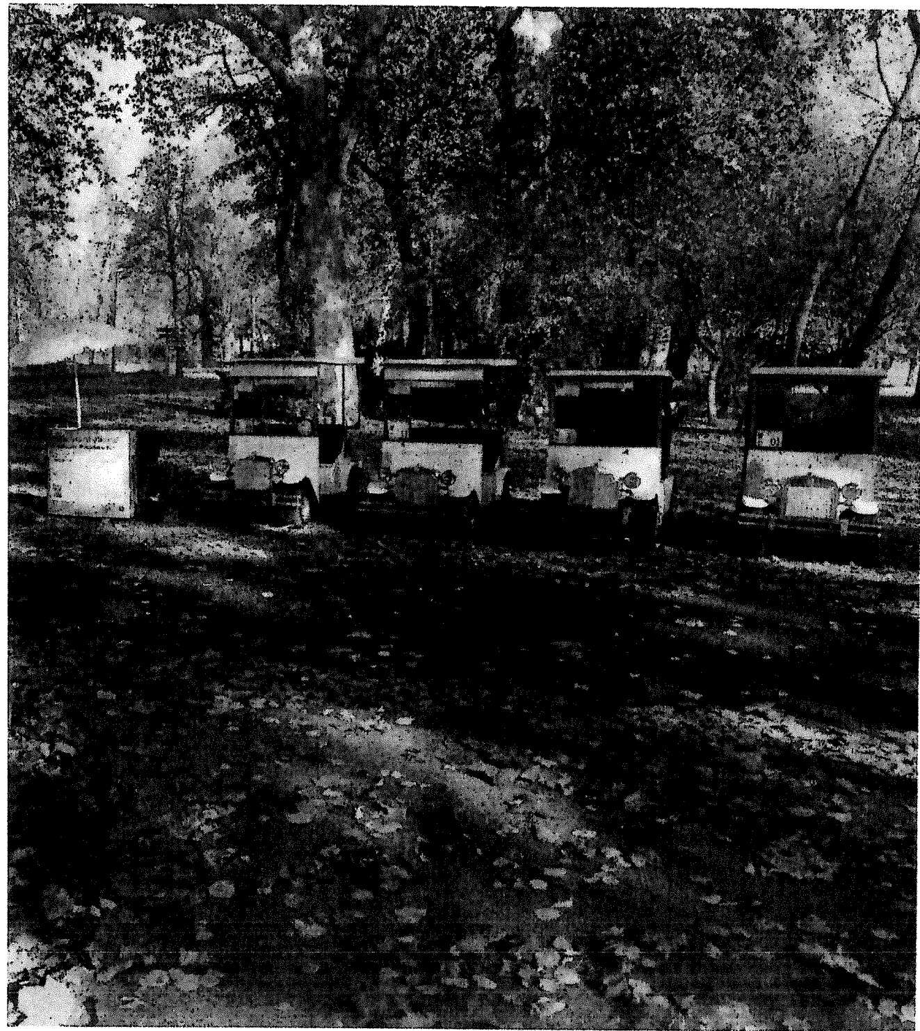
lektromosautó Kft. – Víztorony és főút kavicsos területen kölcsönző

5 db, e. auto + berend. 2 m 2 == 5 db + 2 m 2