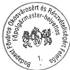
Kerpel-Fronius Gábor főpolgármester-helyettes