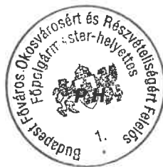
Kerpel-Fronius Gábor főpolgármester-helyettes