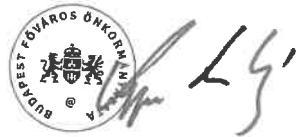
Kerpel-Fronius Gábor főpolgármester-helyettes