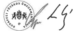
Kerpel-Fronius Gábor főpolgármester-helyettes