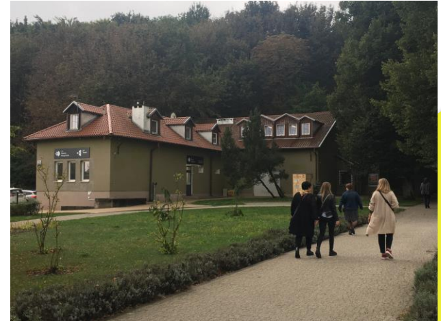
zene, kulturális közösségi ház