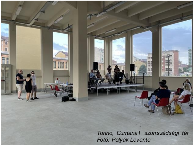
Torino, Curiana1 szomszédsági tér