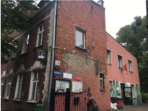
szomszédsgái ház és közösségi tér szociálisan leszakadó városrészben