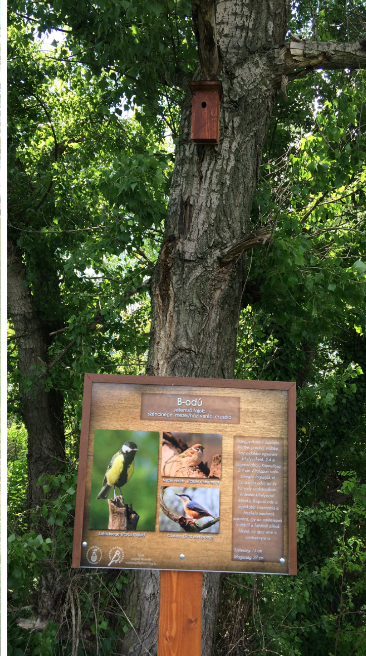
Fekete István tanösvény