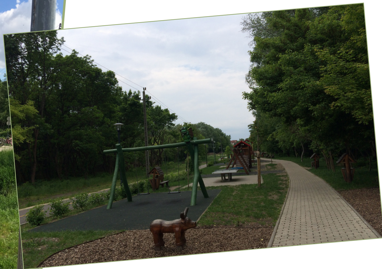
Hermina családi pihenőpark