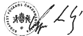
Kerpel-Fronius Gábor főpolgármester-helyettes