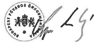
Kerpel-Fronius Gábor főpolgármester-helyettes