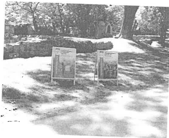
mobil kulturális tájékoztató táblák