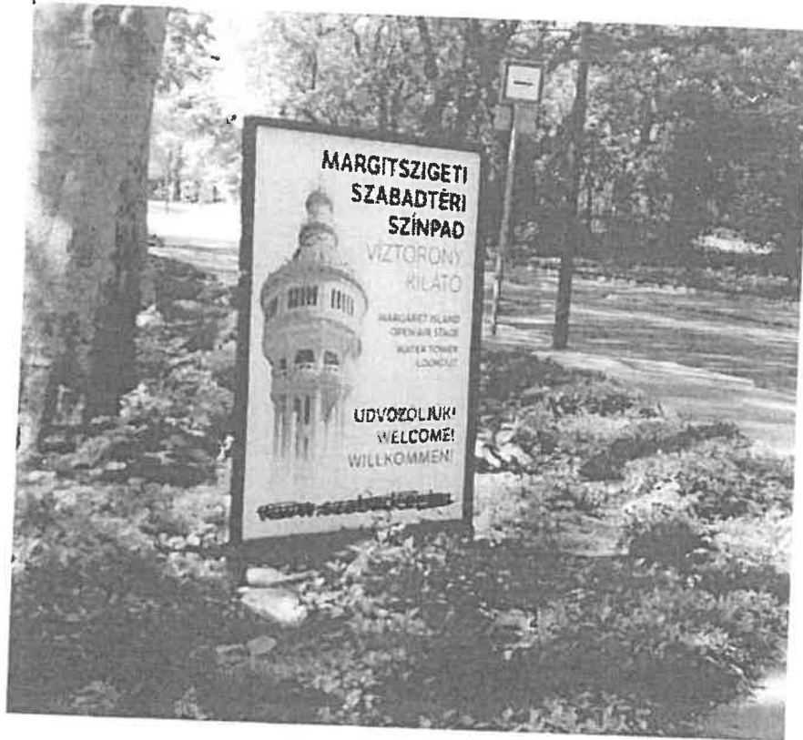
fix kulturális tájékoztató tábla