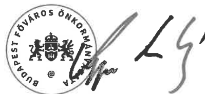
Kerpel-Fronius Gábor főpolgármester-helyettes