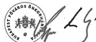
Kerpel-Fronius Gábor főpolgármester-helyettes