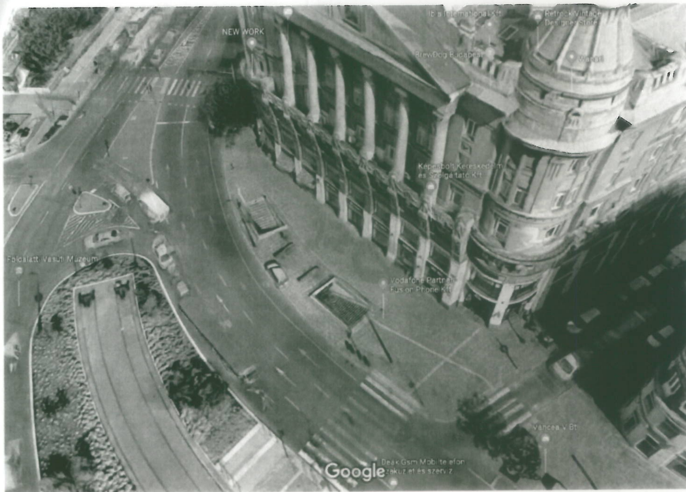
5 m