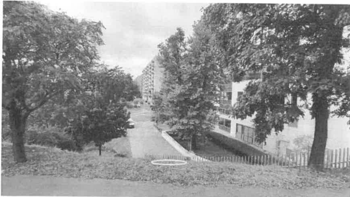
2. ábra B1 fúrás tervezett helye

Fontos megjegyezni, hogy a tervezett fúráshelyek az esetlegesen feltárt közművek miatt a helyszínen némileg módosulhatnak.