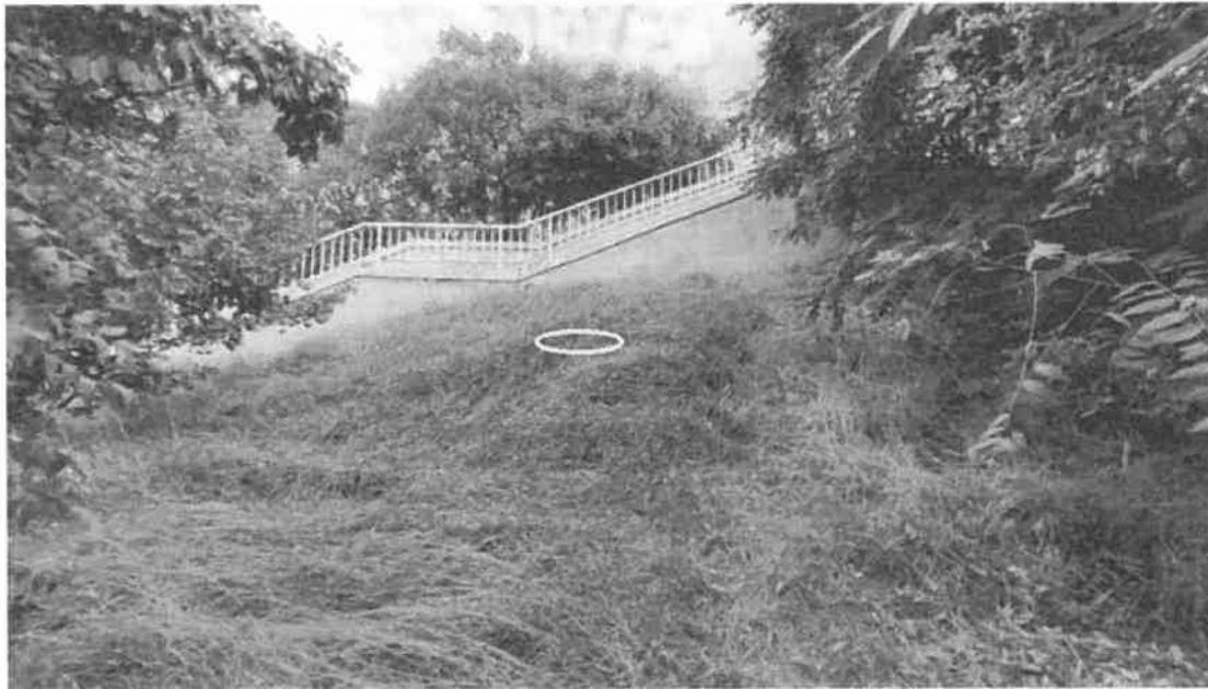
3. ábra B2 fúrás tervezett helye