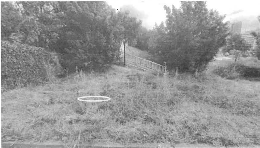
4. ábra G1 és CPT1 feltárás tervezett helye