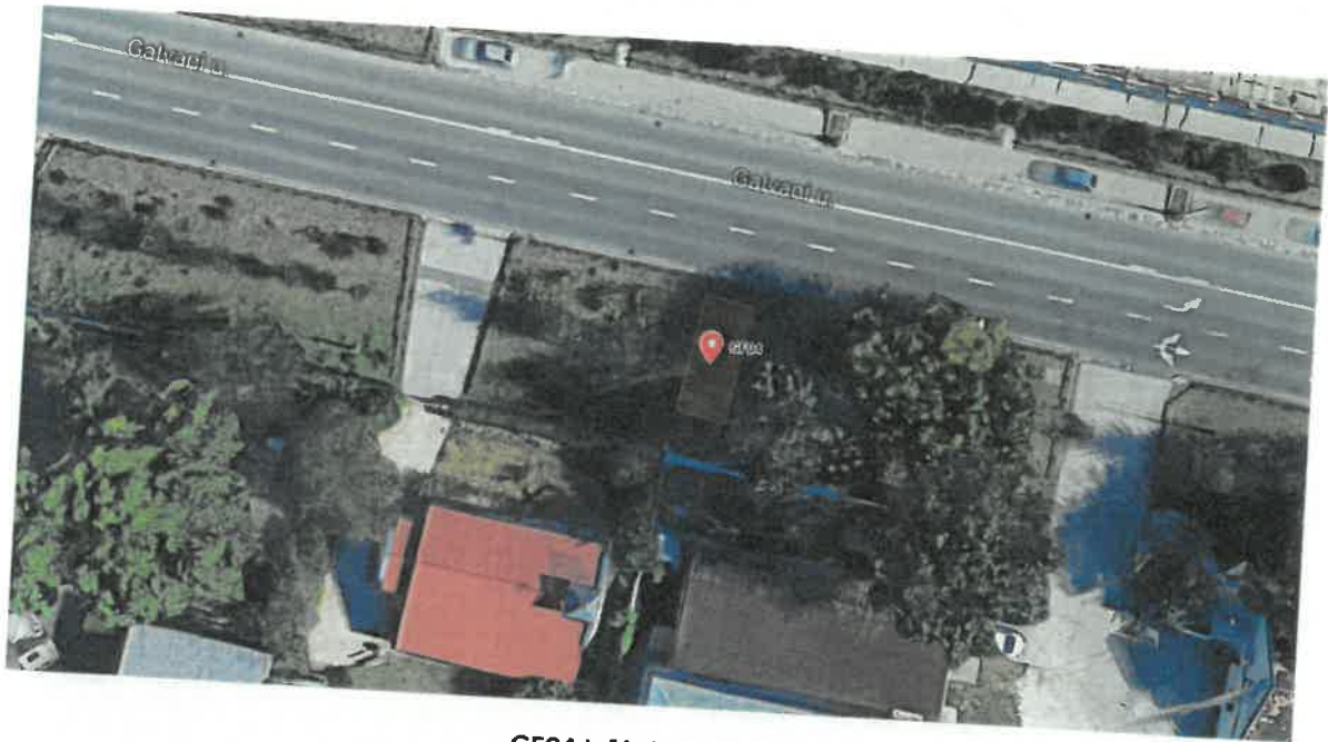
GF04 j. fúrési helyszín