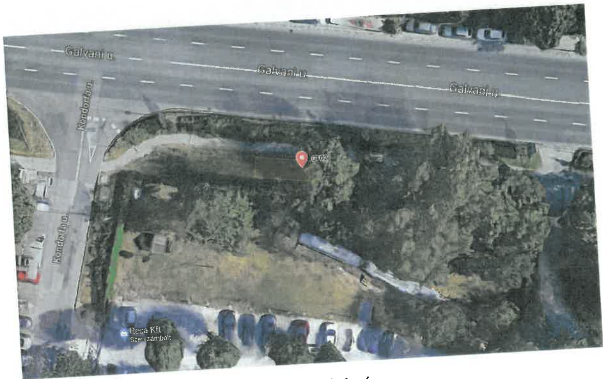
GF02 j. fúrési helyszín