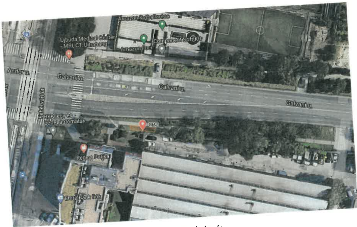
GF01 j. fúrési helyszín