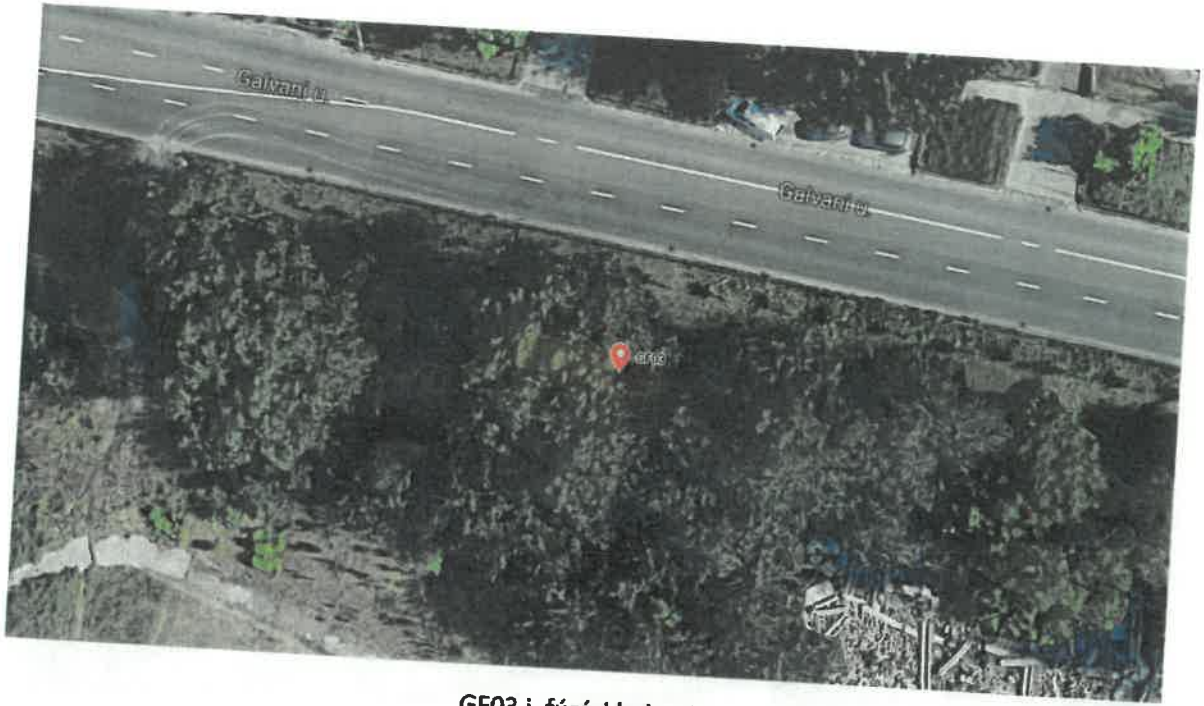
GF03 j. fúrési helyszín