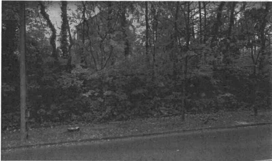
A fűrés tervezett helye a Budakeszi út mellett található zölds felületen, a fák vonalában található.