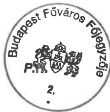
dr. Számadó Tamás

A főpolgármester – a katasztrófavédelemről és a hozzá kapcsolódó egyes törvények módosításáról szóló 2011. évi CXXVIII. törvény 46. § (4) bekezdése alapján gyakorolt –hatáskörében eljárva: