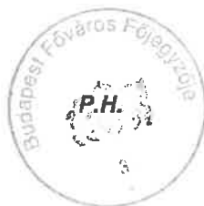
dr. Számadó Tamás

A főpolgármester – a katasztrófavédelemről és a hozzá kapcsolódó egyes törvények módosításáról szóló 2011. évi CXXVIII. törvény 46. § (4) bekezdése alapján gyakorolt –hatáskörében eljárva: