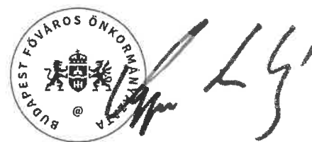
..... Kerpel-Fronius Gábor főpolgármester-helyettes