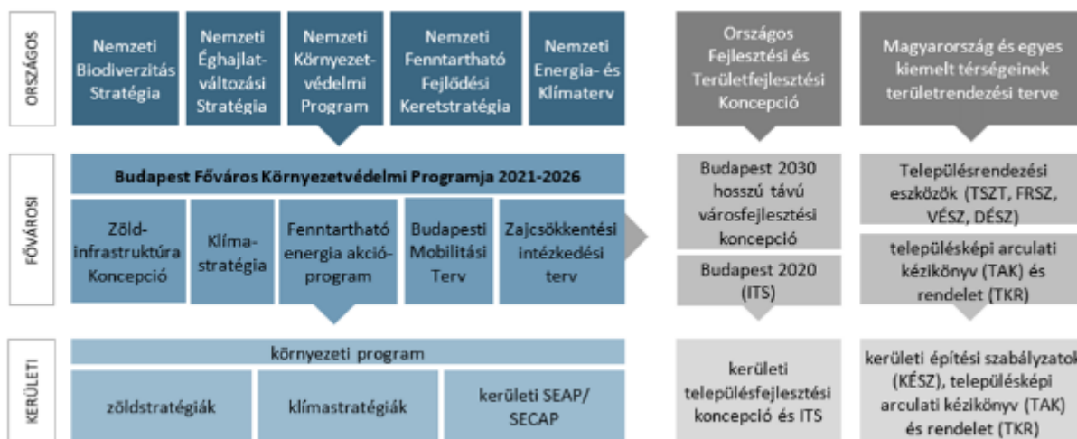
2. ábra: A környezetvédelmi program elhelyezkedése az országos és fővárosi tervek rendszerében