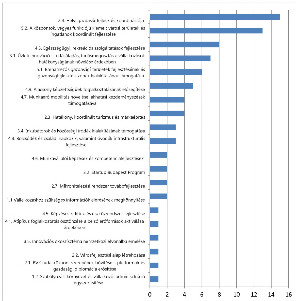
A projektek megoszlása középtávú intézkedés szerint

Az „5. Budapesti üzleti környezet fejlesztése” célhoz 19 projekt tartozik. „5.1. Barnamezős gazdasági területek fejlesztéséhez” hat kerületi projekt kapcsolódik, míg az „5.2. Alközpontok, vegyes funkciójú kiemelt városi területek és ingatlanok koordinált fejlesztését” 13 projekt támogatja. Meg kell jegyeznünk, hogy az akcióterv nem tartalmazza a stratégia „5.3. Városi életminőséget és az ingatlanfejlesztéseket kiszolgáló közmű infrastruktúra biztosítása”, „5.4. Városi épített környezet értékteremtő fejlesztése” és „5.5. Városterység gazdaságának működését és növekedését biztosító mobilitás fejlesztései” középtávú intézkedéseikhez kapcsolódó közvetett gazdaságfejlesztési hatással bíró projekteket, melyek az ágazati stratégiákban és tervekben (Budapest 2020, Balázs Mór-terv) lettek rögzítve.